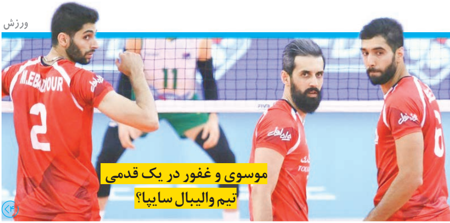
موسوی و غفور در یک قدمی تیم والیبال سایپا؟