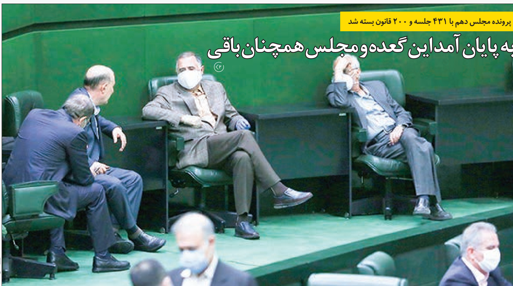
برونده مجلس دهم با ۴۳۱ جلسه و ۲۰۰ قانون بسته شد