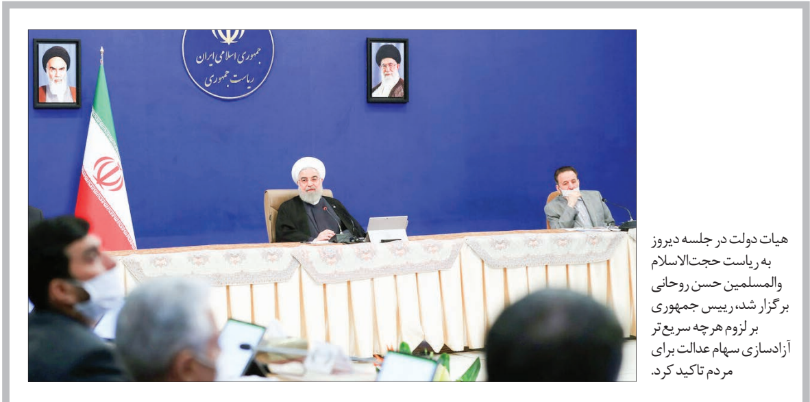
هیات دولت در جلسه دیروز به ریاست حجت الاسلام والمسلمین حسن روحانی برگزار شد، رئیس جمهوری بر لزوم هر چه سریع تر آزادسازی سهام عدالت برای مردم تاکید کرد.

سفر در این روزها ممنوع نیست ولی سفر غیر ضروری هم عاقلانه نیست. پس ایرانگردی و گردشگری مجازی را بازدید مجازی از شهرهای ایران را با استفاده از عکس های ۳۶۰ درجه از دست ندهید. فقط کافی است عبارت https://omid360.com/iran را سرچ کنید.