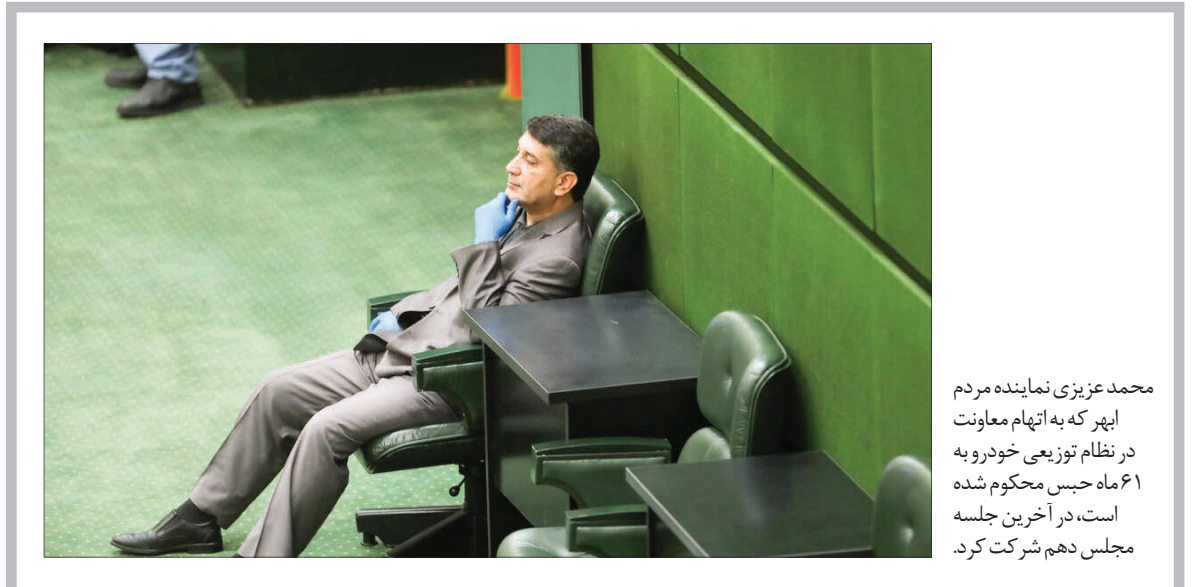
محمد عزیزی نماینده مردم اهر که به اتهام معاونت در نظام توزیعی خودرو به ۶۱ ماه حبس محکوم شده است، در آخرین جلسه مجلس دهم شرکت کرد.