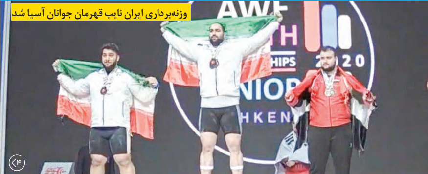
وزنه‌برداری ایران نایب قهرمان جوانان آسیا شد