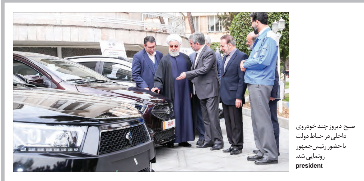
صبح دیروز چند خودروی داخلی در حیاط دولت با حضور رئیس‌جمهور رونمایی شد. president