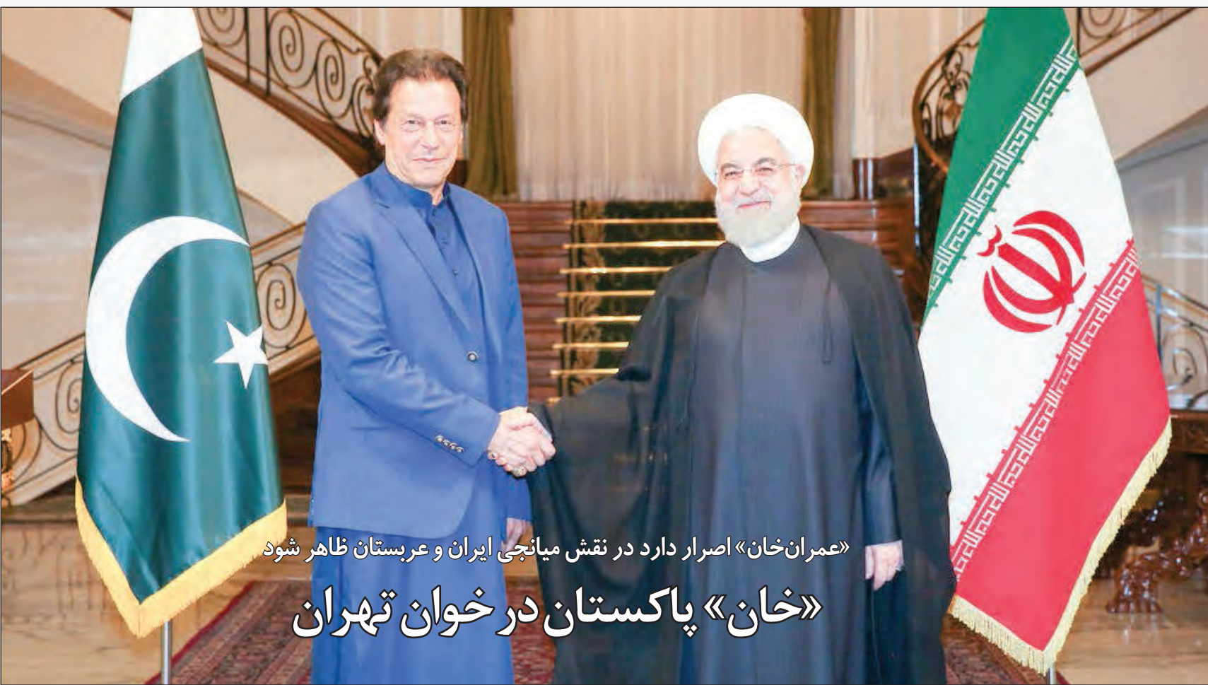
«عمران خان» اصرار دارد در نقش میانجی ایران و عربستان ظاهر شود «خان» پاکستان در خوان تهران