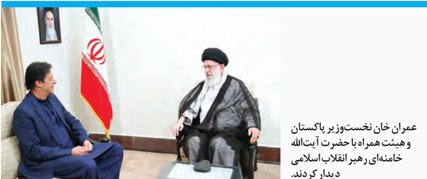
عمران خان نخست وزیر پاکستان و هیئت همراه با حضرت آیت الله خامنه ای رهبر انقلاب اسلامی دیدار کردند.