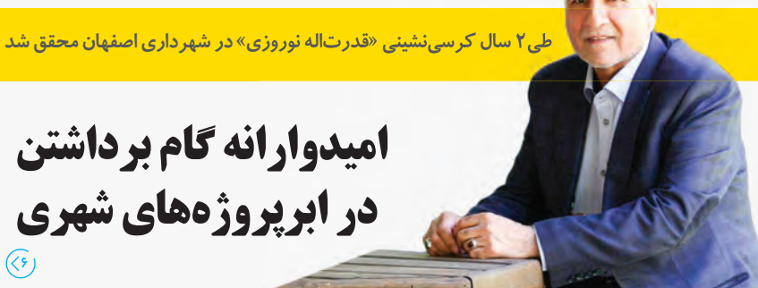
طی ۲ سال کرسی‌نشینی «قدرت‌آله نوری» در شهرداری اصفهان محقق شد