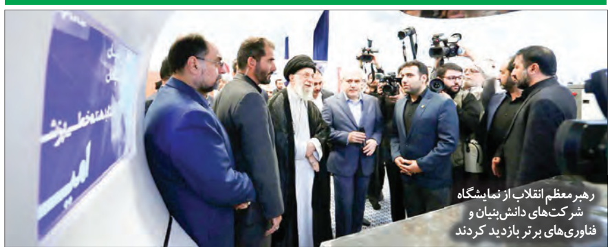
رئیس‌جمهور معظم انقلاب از نمایشگاه شرکت‌های دانش‌بنیان و فناوری‌های برتر بازدید کردند