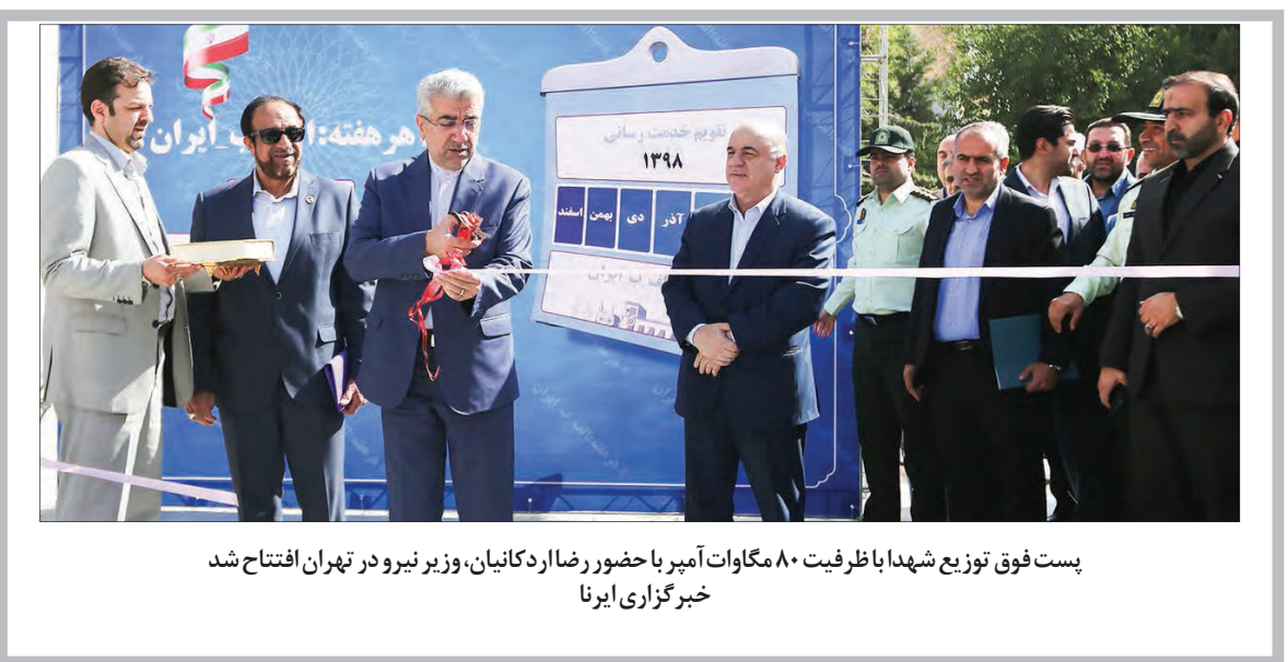
پست فوق توزیع شهدا با ظرفیت ۸۰ مگاوات آمپر با حضور رضا در کانیان، وزیر نیرو و در تهران افتتاح شد خبرگزاری ایرنا