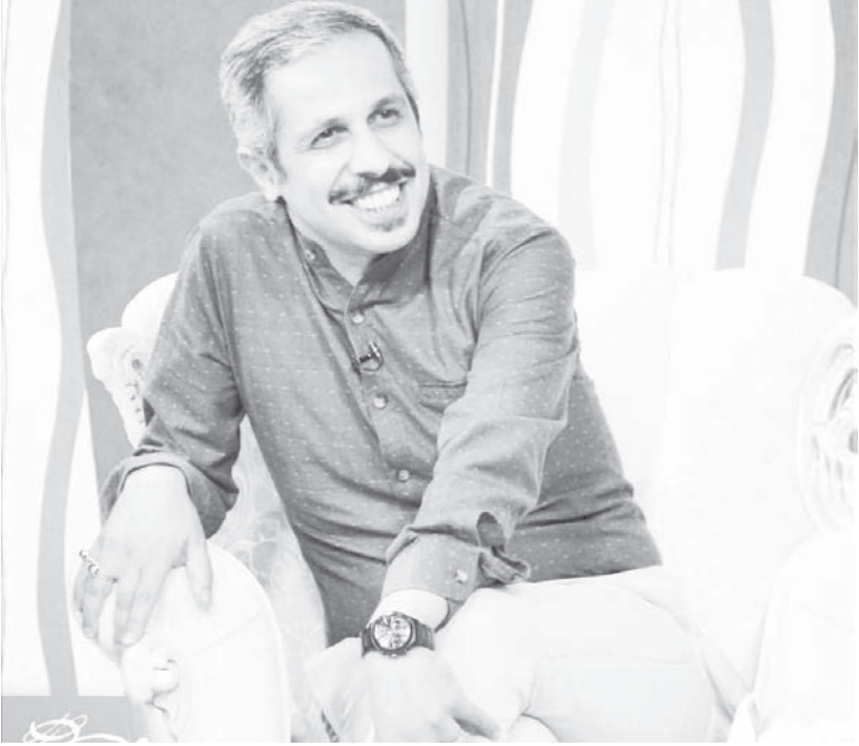
زمانی که نام جواد رضویان مطرح شد شاید ۵۰ نفر از کامنت منفی دادند و حتی یکی در پیامی عنوان کرد که به کجا می‌رویم

عنوان کرد: قسدر برنامه تکراری روی آنتن ببریم؟ برنامه‌های مسال تحولی چقدر با یکدیگر تفاوت داشتند؟ من ۲۵ سال است که در تلویزیون کار می‌کنم و خودم می‌دانم که اکثر این برنامه‌ها تکراری است یا برنامه‌های ترکیبی جدید بسیار سخت می‌گیرد. وی درباره حضور سلبریتی‌ها به عنوان مجری گفت: الان مویی ایجاد شده که چرا بازیگرها اجرا می‌کنند؟ من اعتقاد دارم افرادی که در این برنامه استفاده کرده‌ام سر جای خود هستند چون ما مجری نداریم که بتواند بازی هم داشته باشد و جواد رضویان و شهره سلطانی هم بازی و هم اجرا می‌کنند. من آماده‌ام یک مجری خوب باشد که بتوانم به عنوان تهیه‌کننده از او استفاده کنم و قول می‌دهم تا آخر عمر هیچ سلبریتی نیآورم، اما مشکل اینجاست که ما به عنوان رسانه اهمال کرده‌ایم؛ بعد از احسان علیخانی و رضا رشیدپور چه مجری جدیدی تربیت کرده‌ایم. زمانی که نام جواد رضویان مطرح شد شاید ۵۰ نفر از مجریان به من کامنت منفی دادند و حتی یکی در پیامی عنوان کرد که به کجا می‌رویم