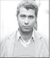
اصغر نعیمی / نویسنده و کارگردان سینما اندی گفته «خوشگلایا باید برقصن»، اما ساسی مانکن علی مطهری را به چالش کشیدند، هر دو سلیقه و رقصیدن با آن دعوت کرده؛ پیش از آن نیز بچه مدرسهای‌های متولد دهه هشتاد و نود، با خواندن این ترانه متنوع و رقصیدن با آن آموزه‌های رسمی رایج را به چالش کشاندند، وزیر آموزش و پرورش را دچار دوگانگی «فریب یا نفوذ» کردند و مشخص شد ذهن جناب وزیر در تحلیل این جریان توان درک دلایل دیگر را ندارد. و سوسکی اقدام به خروج از برجام کرده و به احتمال زیاد قیمت ارز و سکه از این هم بالاتر می‌رود و با افزایش قریب‌الوقوع قیمت‌ها از جمله بنزین توری حداقل پنجاه درصدی در انتظاران است و رفیق من دیشب تا صبح نگران این بود که شش ماه دیگر که موعد اجاره خانه‌اش تمام می‌شود با این وضعیت چه خاکی به سرش ببرد.

قابل توجه این که، درست همان زمانی که علی مطهری در پی یافتن عاملان ضیط و پخش کلیپ جنتلمن داشته از خودش نظریه صادر می‌کرده، دور از چشم او خانواده‌های بسیاری حتی نان شب برای خوردن نداشته‌اند و چند شب قبل از این اظهار نظر آقای مطهری و دعوت به رقص او توسط ساسی مانکن، آقای صدایی هم در عروسی پسرش با آهنگ جنتلمن رقصید و به ما فهماند، برخلاف نظر اندی که «خوشگلا باید برقصن» در کنار خوشگلا خوش‌قلب‌ها و مهربان‌ها هم می‌توانند -و باید- برقصند!!