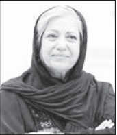
رخشان بنی‌اعتماد / کارگردان سینما و تلویزیون «به دنیا آمدن» روایت به ظاهر ساده و در عین حال بسیار عمیق از تردیدها و ترس‌های انسان معاصر از جهان پر خشونت و پراضطراب کنونی است. درد آگاهی در برخورد با واقعیت‌های پیرامونی، بغض فرو خفته طیف وسیعی از طبقات میانی جامعه است. طیفی که به حقوق شهروندی و انسانی خود اشراف دارد و تناقضات و تضادهای ساختار اجتماعی را با استانداردهای حداقلی می‌شناسد. فشار اقتصادی را با سرخ کردن صورت خود به سیلی تحمل تاب می‌آورد. چگونگی تربیت فرزند برایش چشم‌انداز مشخصی دارد و بچه‌دار شدن برایش معنای صرف تولید مثل ندارد. به حرف بی‌ربط هر آن کسی که دندان دهد نان دهد اعتقاد ندارد و جز خوردن و پسن دادن، به چگونگی رشد و پرورش بچه خود فکر می‌کند و...