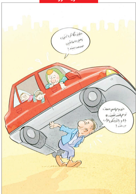
قیمت خودروهای تولید ملی هر روز بیشتر از دیروز