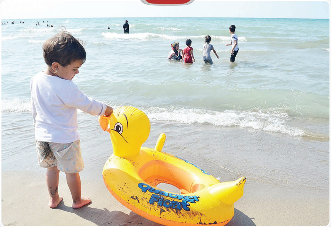
مسافران تابستانی در مازندران