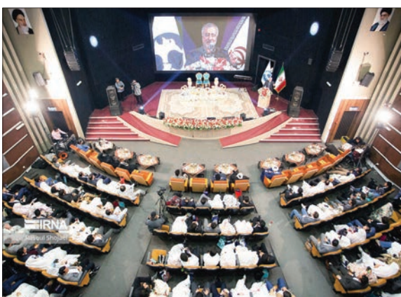
جشن ازدواج ۴۰۰ زوج دانشجو همزمان با اعیاد شعبانیه از سوی نهاد نمایندگی مقام معظم رهبری و در سالن پیامبر اعظم (ص) دانشگاه اصفهان برگزار شد.