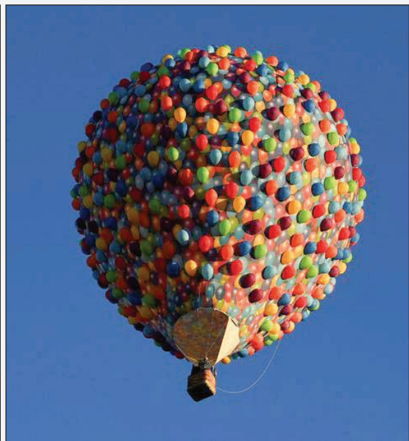
جشنواره بالن در بریستول انگلیس.