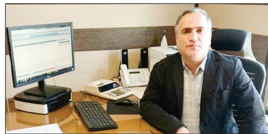
گروه ایران news@nasle-farda.net