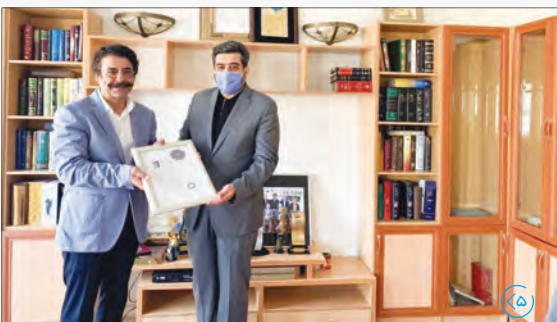
مراسم تودیع و معارفه رئیس سازمان برنامه و بودجه کشور با حضور معاون اول رئیس‌جمهور در این سازمان برگزار شد.