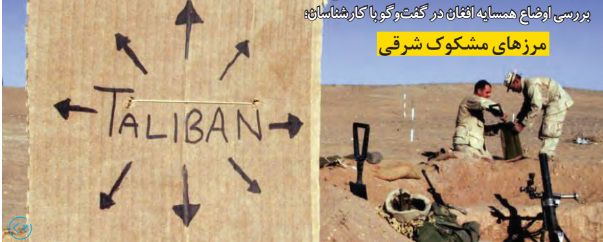
بررسی اوضاع همسایه افغان در کمت و کوبا کارشناسان؛ مرزهای مشکوک شرقی