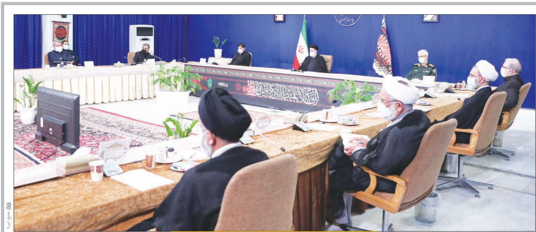
در جلسه ستاد ملی مقابله با کرونا مطرح شد؛