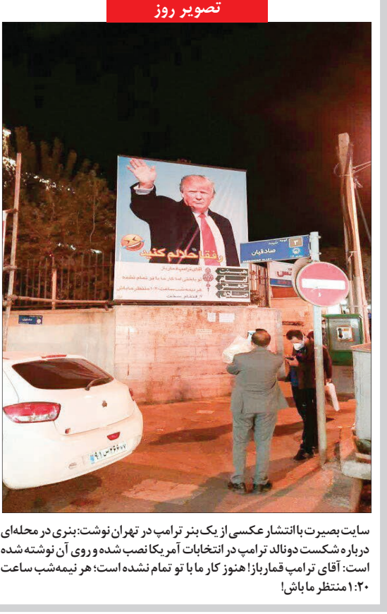
سایت بصیرت با انتشار عکسی از یک بنر ترامپ در تهران نوشت: بنری در محله ای درباره شکست دونالد ترامپ در انتخابات آمریکا نصب شده و روی آن نوشته شده است: آقای ترامپ قماربازا هنوز کار ما با تو تمام نشده است: هر نیمه شب ساعت ۱:۳۰ منتظر ما باش!

عبد امام علی (ع) شرافت و بزرگی نزد خداوند سبحان به نیکویی کردارهاست، نه به نیکویی گفتارها. نرمی ز حد مبر که چو دندان مار ریخت / هر طفل نی سوار کند تاز یانه اش! «صائب تبریزی»