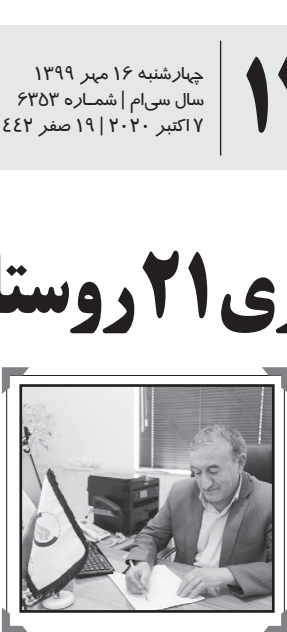
مدیر عامل سفرنا

وی بیان کرد: برنامه بسیج مردمی محله‌ها همان شعار هر خانه یک پایگاه سلامت است، چون نمی‌توان برای هر فرد بازرس بهداشتی تعیین کرد، باید هر شخص در کنترل بیماری کووید-۱۹ مسئولیت‌پذیر باشد و به صورت داوطلبانه نقش بسیج سلامت محله را ایفا کند.