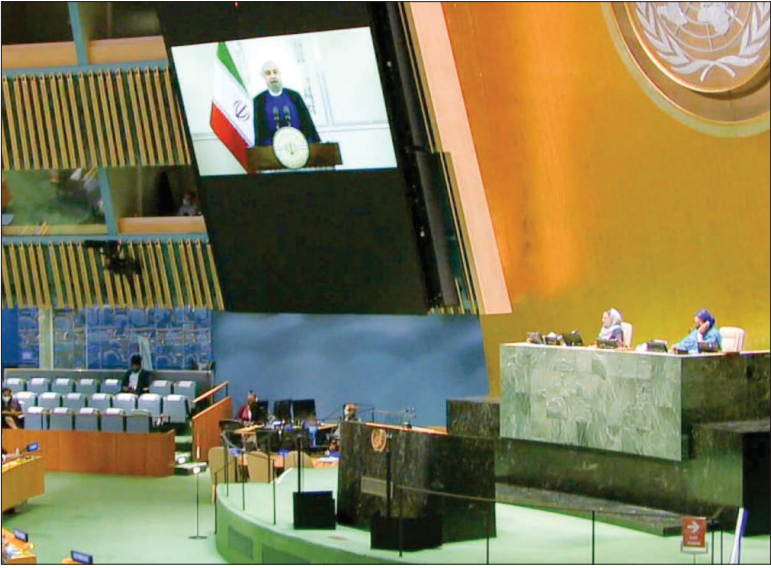
جلسه‌ای در کنگره ملی ایران

جهانی، بهبودی می‌کوشند تا ایران را از حداقل نیازهای دفاعی محروم سازند و محدودیت‌های تسلیحاتی ایران را به‌رغم نص صریح قطعنامه ۲۲۳۱ تمدید کنند. رئیس‌جمهوری اظهار داشت: این‌جا لازم می‌دانم از روسای دوره‌های شورای امنیت در ماه‌های اوت و سپتامبر و ۱۳ عضو این نهاد به ویژه کشورهای روسیه و چین تشکر کنم که دو بار به صورت قاطع به استفاده ابزاری و غیرقانونی آمریکا از شورای امنیت و قطعنامه ۲۲۳۱ با صدای بلند «ه» گفتند؛ این یک پیروزی نه