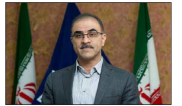
مازندران / گروه استان‌ها news@nasleforda.net