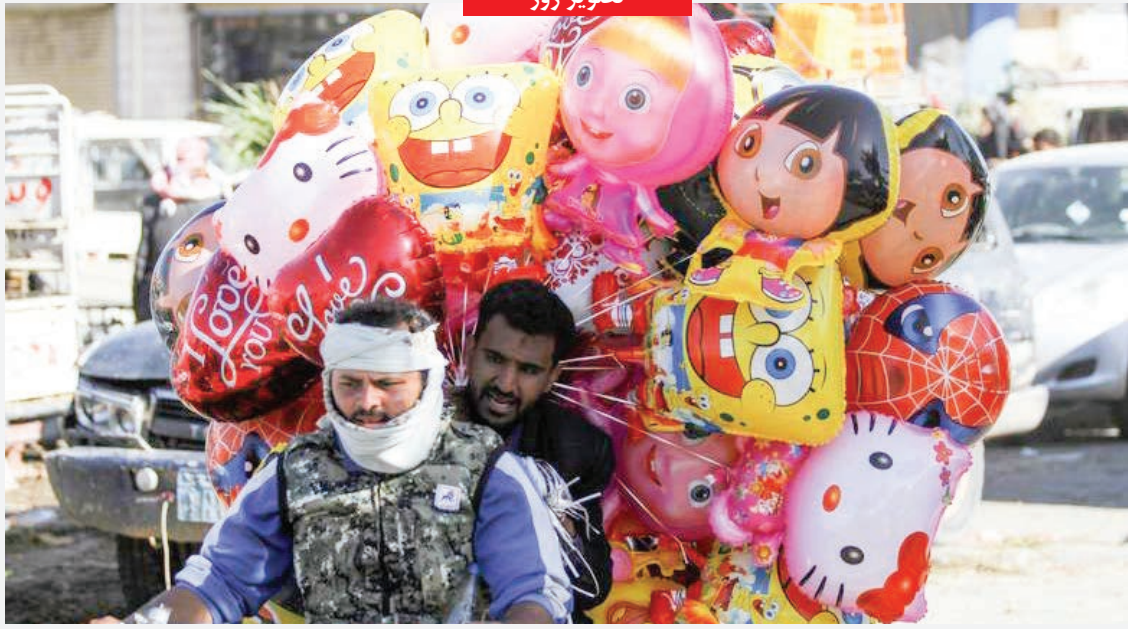
حال و هوای ایام عید قربان در بازار شهر صنعا در یمن