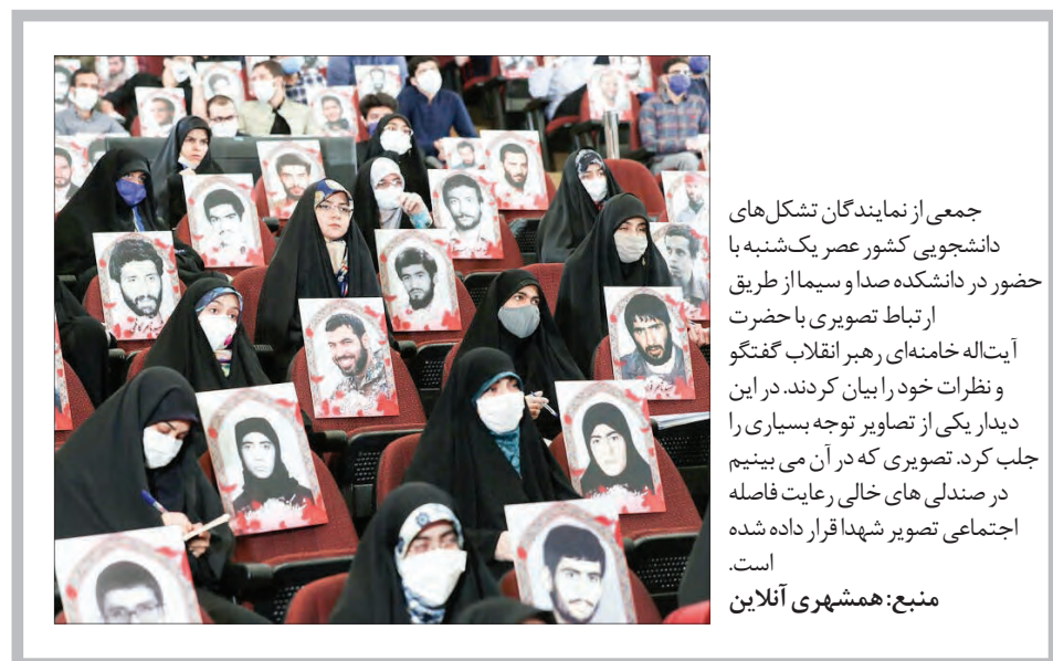
جمعی از نمایندگان تشکل‌های دانشجویی کشور عصر یکشنبه با حضور در دانشکده صدا و سیما از طریق ارتباط تصویری با حضرت آیت‌الله خامنه‌ای رهبر انقلاب گفتگو و نظرات خود را بیان کردند. در این دیدار یکی از تصاویر توجه بسیاری را جلب کرد. تصویری که در آن می‌بینیم در صندلی‌های خالی رعایت فاصله اجتماعی تصویر شهدا قرار داده شده است.