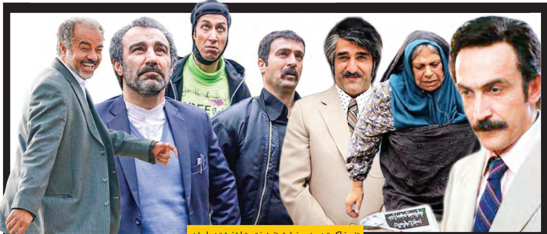
«زیرخاکی» هم به سر نوشت «نون خ» و «پایتخت» دچار شد