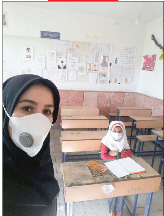
یک معلم خراسانی با انتشار این عکس نوشت: از بین تمام دانش آموزان کلاس فقط یک نفر آمده است.