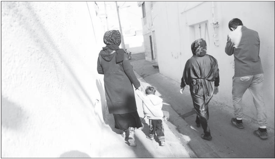
عکس شهرداری بخت