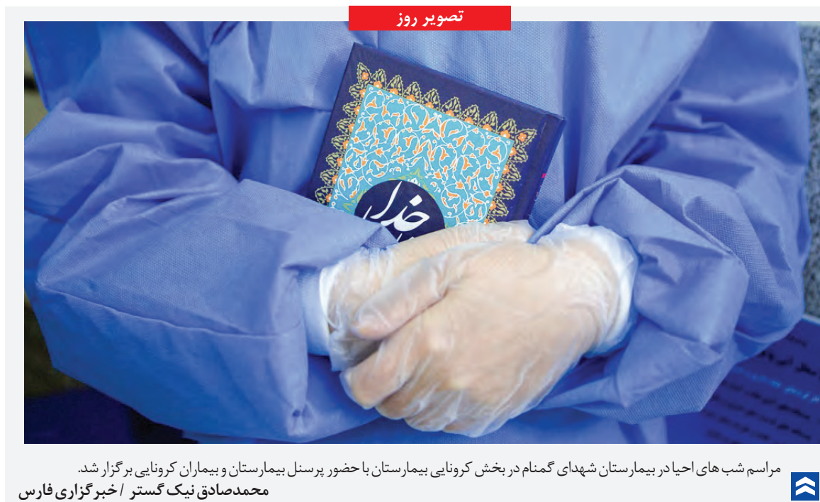
مراسم شب های احیا در بیمارستان شهدای گمنام در بخش کرونایی بیمارستان و بیمار کارونایی برگزار شد.