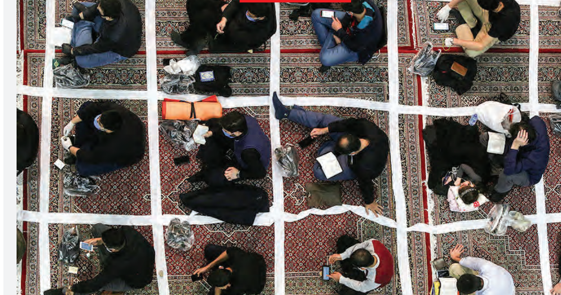
مراسم معنوی و عبادی اعیان شب نوزدهم ماه مبارک رمضان با رعایت نکات بهداشتی در مسجد ارگ تهران برگزار شد.