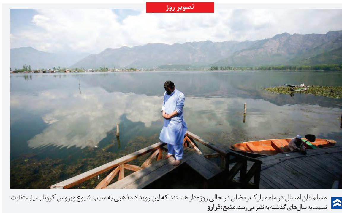
تصویر روز مسلمانان امسال در ماه مبارک رمضان در حالی روزهدار هستند که این رویداد مذهبی به سبب شیوع ویروس کرونا بسیار متفاوت نسبت به سال های گذشته به نظر می رسد.