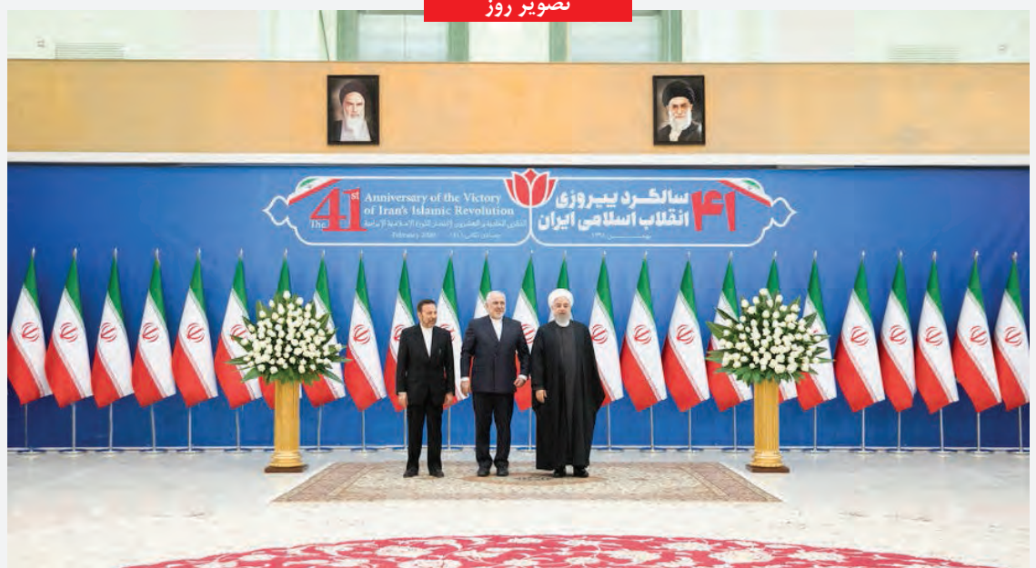
دیدار و تبریک سفرای خارجی مقیم تهران با رئیس جمهور در آستانه سالگرد پیروزی انقلاب اسلامی