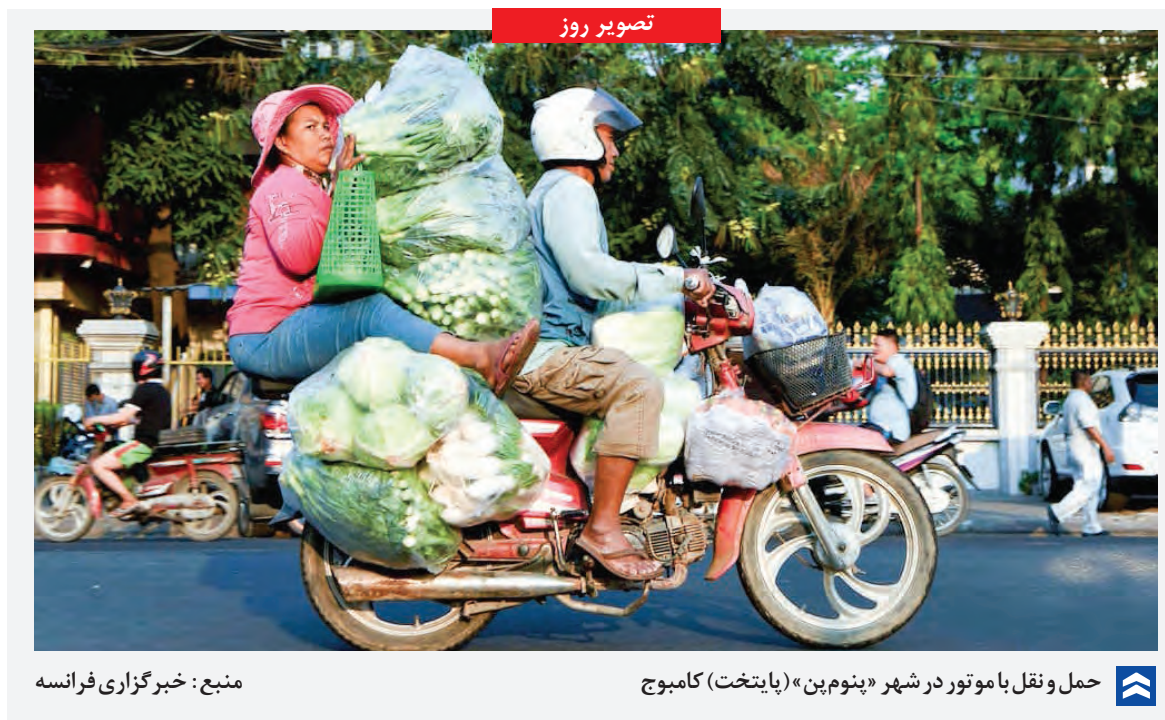
حمل و نقل با موتور در شهر «پنوم پن» (پایتخت کامبوج)