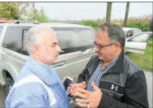
گیلان