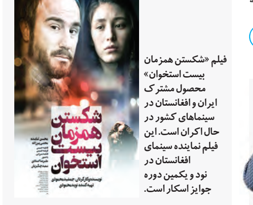
فیلم «شکستن همزمان بیست استخوان» محصول مشترک ایران و افغانستان در سینماهای کشور در حال اکران است. این فیلم نماینده سینمای افغانستان در توکد و یکمین دوره جوایز اسکار است.