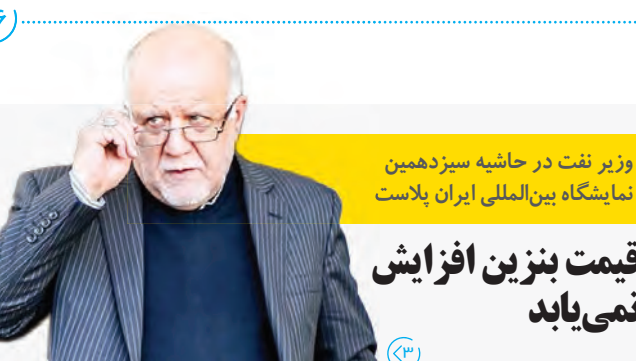
وزیر نفت در حاشیه سیزدهمین نمایشگاه بین‌المللی ایران پلاست قیمت بنزین افزایش نمی‌یابد