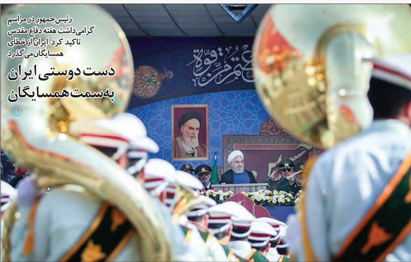
رئیس‌جمهور در مراسم گرمی داشت هفته دفاع مقدس تاکید کرد: ایران از خطای همسایگان می‌گذرد دست دوستی ایران به سمت همسایگان