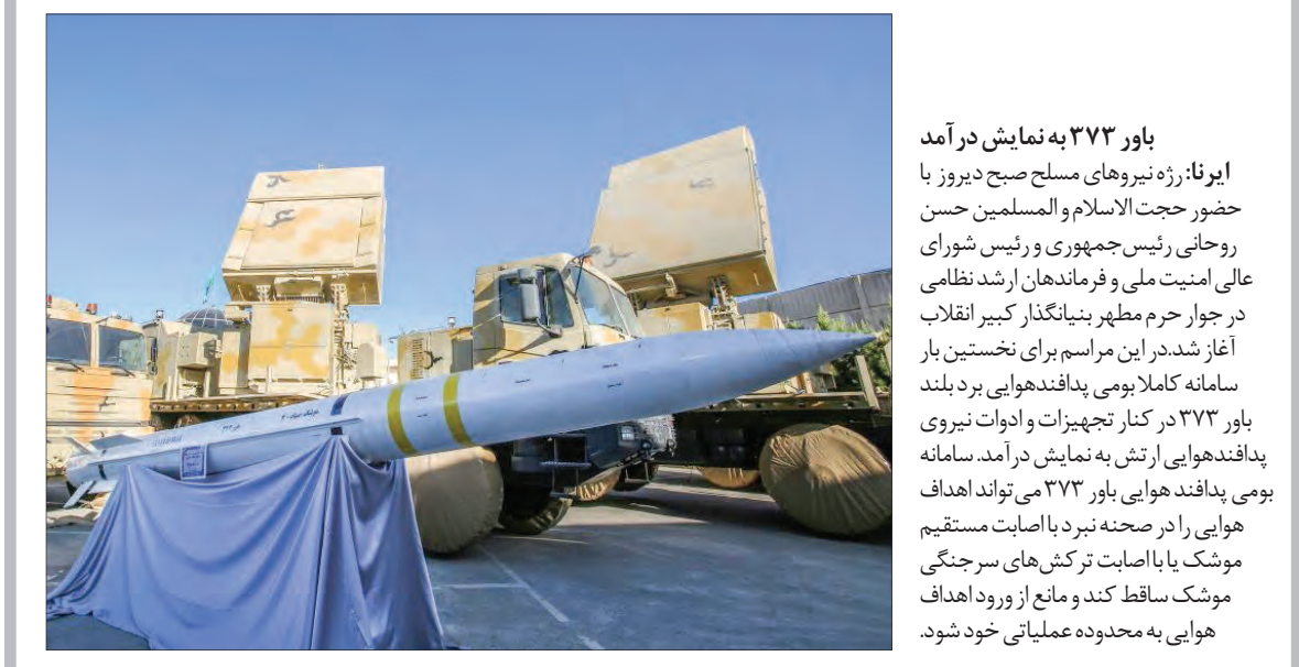
باور ۳۷۲ به نمایش در آمد: ایرنا: رژه نیروهای مسلح صبح دیروز با حضور حجت‌الاسلام والمسلمین حسن روحانی رئیس‌جمهوری و رئیس شورای عالی امنیت ملی و فرماندهان ارشد نظامی در جوار حرم مطهر بنیانگذار کبیر انقلاب آغاز شد. در این مراسم برای نخستین بار سامانه کاملاً بومی پدافند هوایی برد بلند باور ۳۷۲ در کنار تجهیزات و ادوات نیروی پدافند هوایی ارتش به نمایش درآمد. سامانه بومی پدافند هوایی باور ۳۷۲ می‌تواند اهداف هوایی را در صحنه نبرد با اصابت مستقیم موشک یا با اصابت ترکش‌های سرچنگی موشک ساقط کند و مانع از ورود اهداف هوایی به محدوده عملیاتی خود شود.