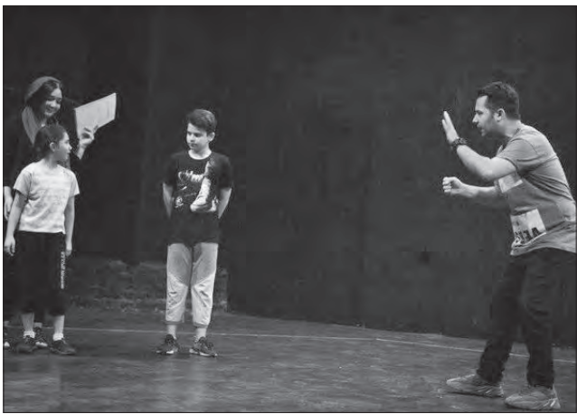
ستاره موزیکال الیور توییست در مری پابینز