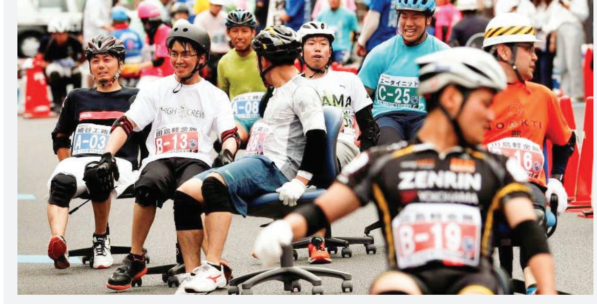
شهر «هانپو» واقع در ۶۰ کیلومتری شمال توکیو، پایتخت ژاپن میزبان صدها نفر از کسانانی بود که قصد داشتند در مسابقه صندلی سواری شرکت کنند.