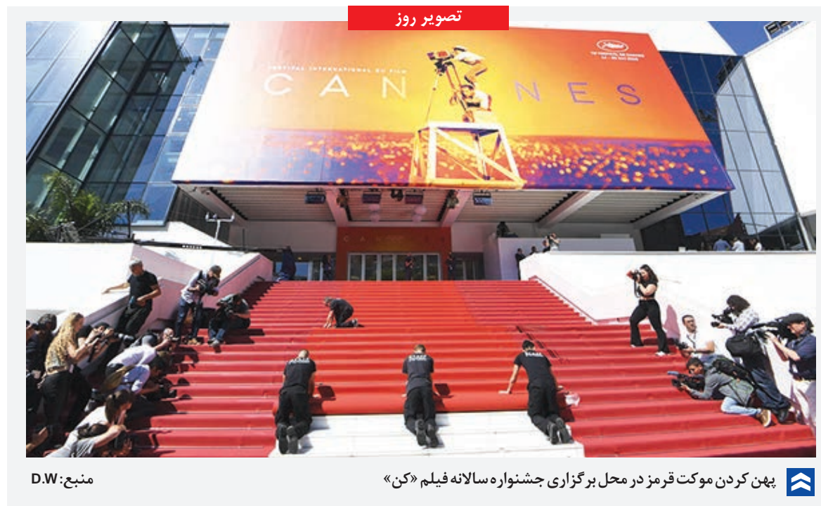
پهن کردن موکت قرمز در محل برگزاری جشنواره سالانه فیلم «کن»