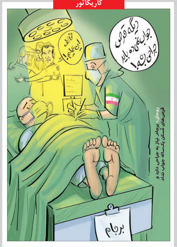
روحانی: احساس کردیم که برجام نیاز به یک جراحی دارد و قرص های مسکن یک ساله جواب ندادند.

برترانند راسل: گرفتاری دنیا در این است که نادان از کار خود اطمینان دارد و دانا از کار خود مطمئن نیست.