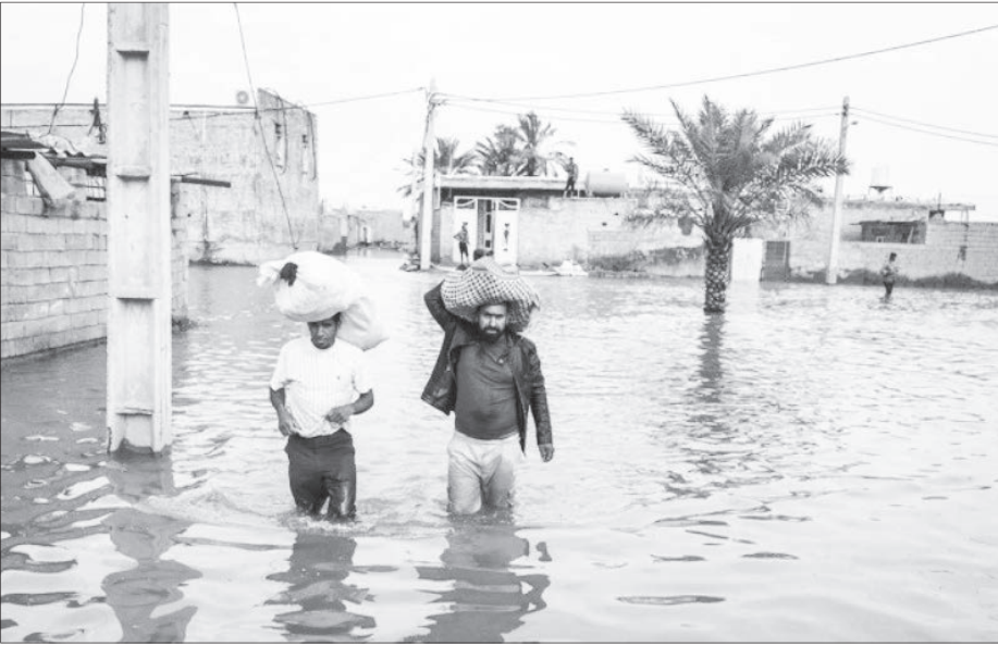
سیلاب در تهران

وقوع بلایای طبیعی بسیار زیاد است و مقصر اصلی انسان‌ها هستند که درمقابل طبیعت ایستاده‌اند؛ درحالی‌که باید برای رویارویی با طبیعت آمادگی داشته باشند.