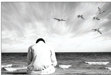
خدایا در زمانی که از دیدار ولی ات محروم هستیم، از این محرومیت و غربت و از تعداد کم و انگشت شمار

قطره ای از دریا قبل از ظهور باید تر گیه نفس کرد مرزویه ربیعی / سر دبیر mr3150110@gmail.com یاران دین حق به تو شکایت می بریم. اگر بدانیم چقدر امام زمان غریب و چقدر طرفداران حق اندک هستند، آن وقت قدر این توجه خودتان به امام زمان (ع) را خواهید دانست که چقدر بشارت ها و روایای صادقه برای همین جمعی که در راه خودسازی و تزکیه نفس و جلب رضایت حضرت بقیه اله قدم برمی دارند، دیده شده است. کوشش کنیم قبل از ظهور آن حضرت جزو مومنین به غیبت باشیم. پیامبر اکرم (ص) دو دسته را برادر خود می دانند: یکی حضرت علی ابن ابی طالب (ع) و یکی مومنین به غیبت که در عصر غیبت از خواب بیدار شده اند و خود را به مقام یاران امام زمان (ع) رسانده اند. رسیدن به این مقام باید از طریق مراقبه نفس انجام شود. مراقبه، یعنی از عملکرد اعضاء و جوارح و آنچه به مغز انسان خطور می کند و افکار