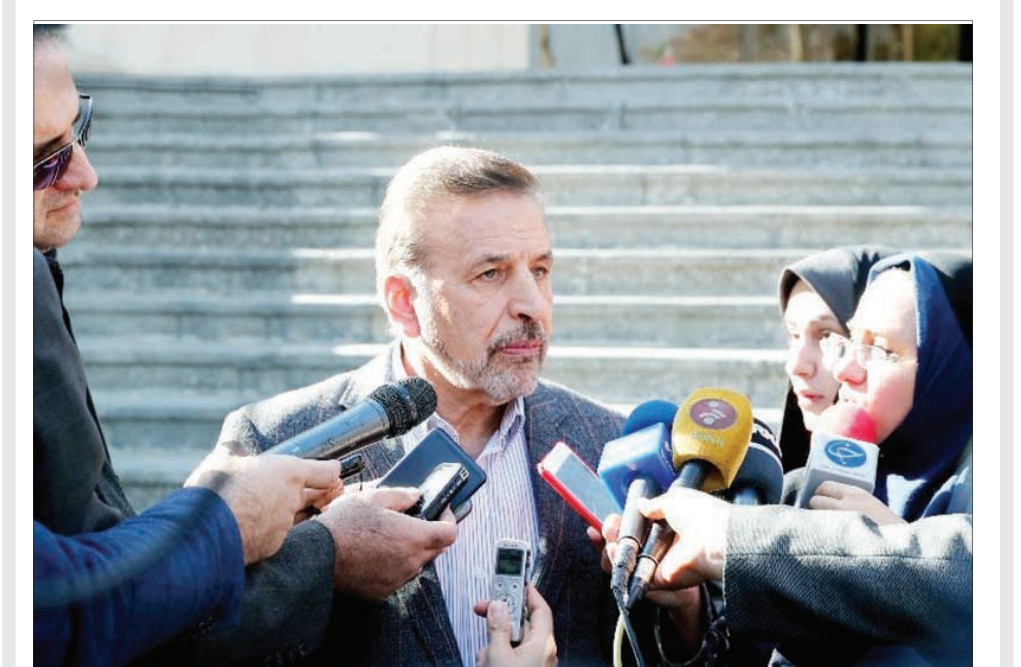
رئیس دفتر رئیس جمهوری گفت: نخستین اقدامی که برای نظارت بیشتر و مقابله با قاچاق مواد سوختی انجام می‌دهیم، احیاء دوباره کارت سوخت است تا از این طریق بر خودروهایی که از بنزین استفاده می‌کنند، نظارت بیشتری داشته باشیم.