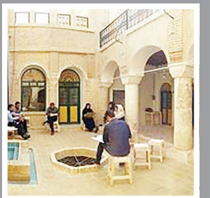
در محله عبدالله بانو وجود دارد. او در خصوص ثبت این بنا در فهرست آثار ملی نیز عنوان کرد: «خانه مقدم هنوز ثبت ملی نشده؛ اما قرار است هفته آینده با همکاری پانزده سازه‌های آبی شوستر نقشه بنا تهیه و نسبت به ارائه گزارش آن برای ثبت در فهرست آثار ملی اقدام شود.

میراث آری: علی محمد چهارمحالی رئیس اداره میراث فرهنگی شوستر از پایان یافتن عملیات مرمت این بنای تاریخی خبر داد و افزود: این مکان به زودی به نگار خانه و سفره خانه سنتی تبدیل خواهد شد و هم‌اکنون نیز در حال تجهیز کردن این اثر فاخر هستیم. او در توضیح تاریخچه این بنا گفت: خانه مقدم از خانه‌های ارزشمند تاریخی شوستر به‌شمار می‌رود که در یکی از محله‌های قدیمی این شهر است. نام عبدالله بانو واقع شده است. این خانه در دوره قاجار متعلق به تاجری شوستری به نام مقدم بود که از خانواده‌های شناخته‌شده در شوستر هستند و املاک زیادی از جمله کاروانسرای مقدم از این خانواده در محله عبدالله بانو وجود دارد. او در خصوص ثبت این بنا در فهرست آثار ملی نیز عنوان کرد: «خانه مقدم هنوز ثبت ملی نشده؛ اما قرار است هفته آینده با همکاری پانزده سازه‌های آبی شوستر نقشه بنا تهیه و نسبت به ارائه گزارش آن برای ثبت در فهرست آثار ملی اقدام شود.