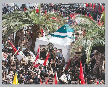
جامعه در قاب

معصومه ابتکار، معاون رئیس جمهوری در امور زنان و خانواده گفت: دولت تدبیر و امید در تلاش است تا پایان دولت دوازدهم ۳۰ درصد از مناصب دولتی در اختیار بانوان قرار گیرد.