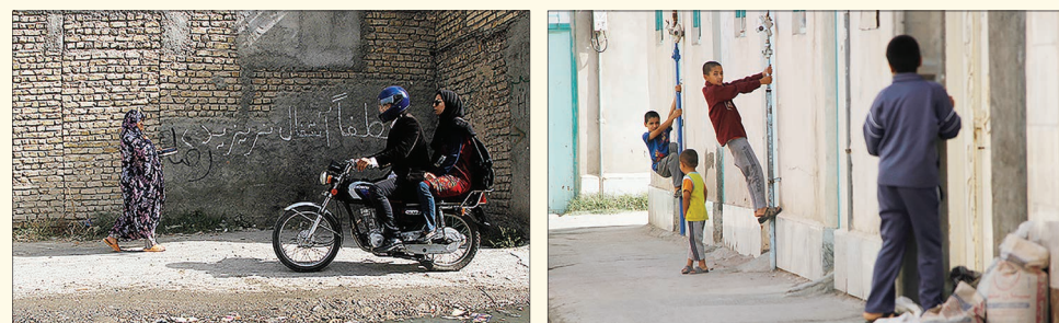
پرسه فقر و اعتیاد در محله های حاشیه ای مشهد

۹۳ دریافت کرد. رئیس هیئت مدیره کانون همیاری و توسعه مهدهای کودک کشور، اضافه کرد: پس از پایان این مرحله، مصوبه دیگری در جهت برگزاری کلاس های پیش دبستانی به آموزش و پرورش داده نشد و از این پس تاکنون، فعالیت این ارگان در زمینه برگزاری دوره پیش دبستانی، غیر قانونی است. به گفته داعی برای یکبار چه شدن