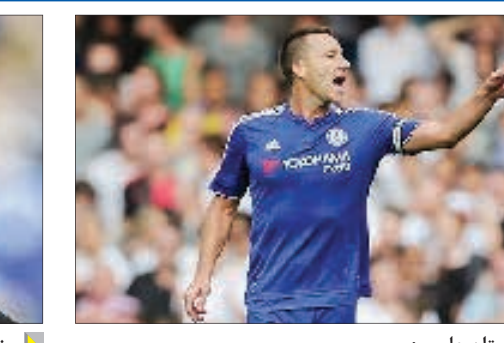
جان تری کاپیتان چلسی؛ دیگر از چلسی انتقاد نمی شود