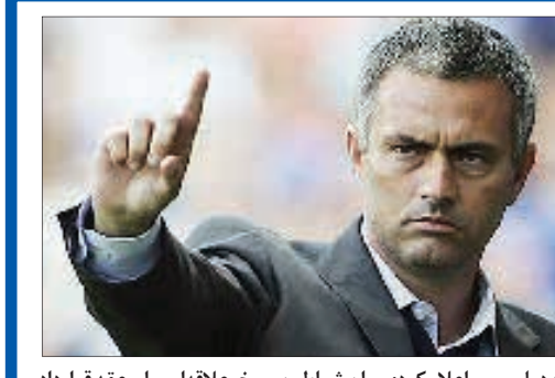
روزنامه دیلی میرر اعلام کرد: سران شیاطین سرخ، علاقه ای برای عقد قرارداد با مورینیو ندارند و رایان گیگز را به او ترجیح می دهند.