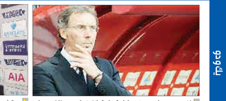
بلان، سرمربی باری سن ژرمن از اینکه بازکنانش نتوانستند مقابل مون پلپله گلزنی کنند، انتقاد کرد.