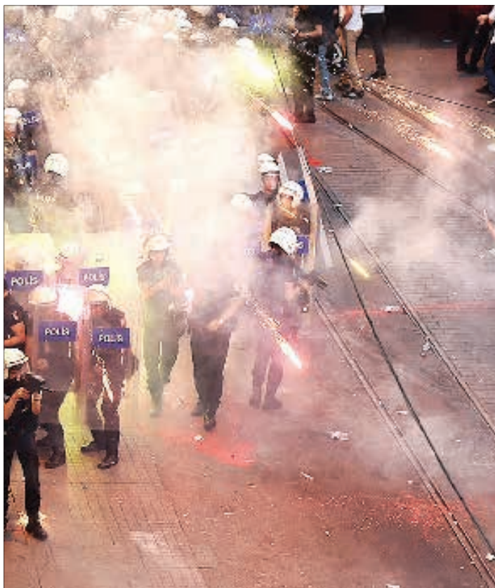
پلیس استانبول به ساختمان روزنامه‌ها زان که مخالف سیاست‌های رجب طیب اردوغان رییس جمهوری ترکیه است، حمله کرد و با صداهای انفجار که مقابل ساختمان روزنامه جمع کرده بودند، درگیر شد و با گاز اشک آور و ماشین آبیاش آنها را متفرق کرد.