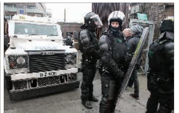
در آستانه صدمین سالگرد قیام استقلال طلب ایرلند ، پلیس دو بمب را در مرکز ایرلند شمالی به دست پلیس کشف کرد.