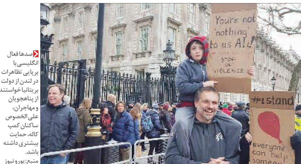
صداهای فعال انگلیسی با برپایی تظاهرات در لندن از دولت بریتانیا خواستند از پناهنچیان و مهاجران، علی‌الخصوص ساکنان کمپ کاله، حمایت بیشتری داشته باشد.