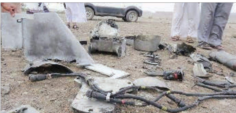
پدافند هوایی ارتش یمن یک فروند پهپاد جاسوسی را در منطقه «السجول» استان إب واقع در جنوب غرب این کشور منهدم کرد.