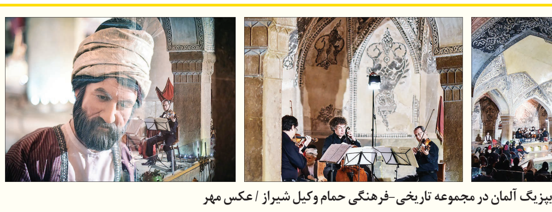
کنسرت گروه سازهای زهی لایپزیگ آلمان در مجموعه تاریخی-فرهنگی حمام وکیل شیراز

نمادهای فرمالیستی در این فیلم از سکوت کتری‌ها و زایچه تغییر کرده برج‌تاروودی‌های شدید به روی آجرهای سوخته، تصویر افتاده شخصیت‌ها داخل آب و... همگی از یک نماد واحد پرده برداری می‌کنند که فریاد می‌زند، اینجا منطقه دورافتاده، محروم و بی‌آب و غذایی است. دست فلزی در این داستان، به منجی دراماتیک فیلم‌نامه تبدیل شده، اگر از وجود چنین المانی در فیلم به مخاطب آگاهی داده نمی‌شود، در فیلم عملیاتی سر و ته و تخیلی به نظر می‌رسد. در نمادگذاری سینمایی، برتری‌های فراوانی نسبت به