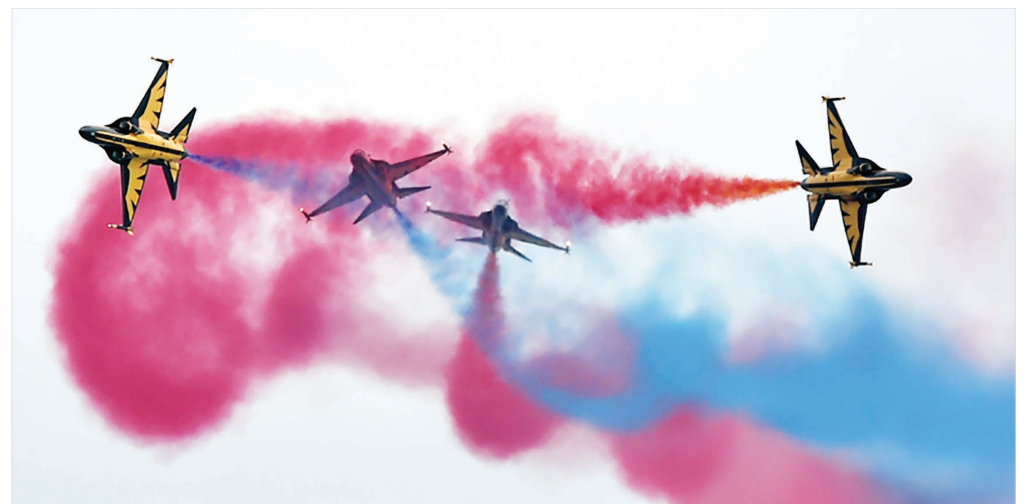
۱۶ گروه آکروبا تیک عقاب سیاه کره جنوبی در حال اجرای برنامه خود در نمایشگاه دستاورد های هوایی هستند. این نمایشگاه در مرکز نمایشگاه های چانگی سنگاپور در حال برگزاری است.