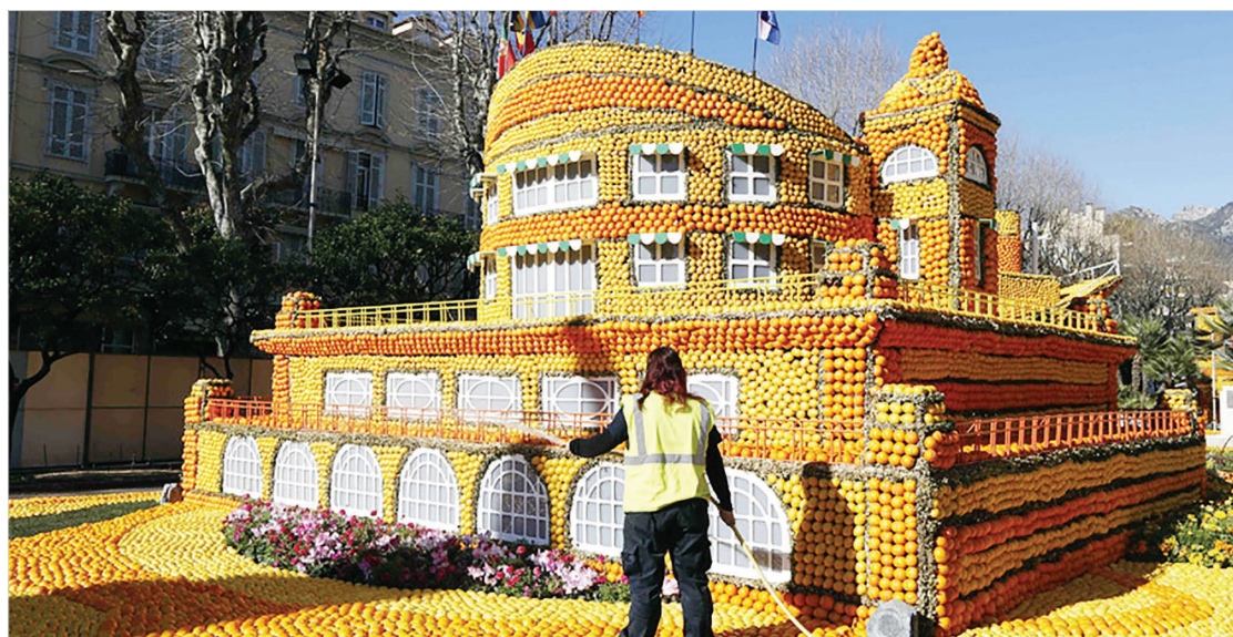
هشتاد و سومین دوره جشنواره مرکبات در شهر منتون فرانسه