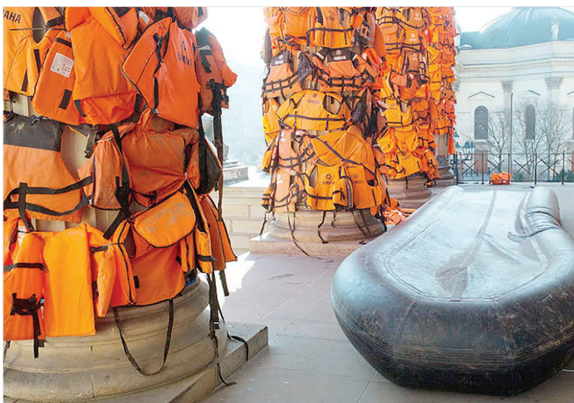
برپایی نمایشگاه هنری از صدها جلیقه به جا مانده از پنجاه جوان ترک و کرد و سوری که از مرز ترکیه به یونان وارد شده اند توسط هنرمند مشهور چینی "آی وی یوی" در شهر برلین آلمان.