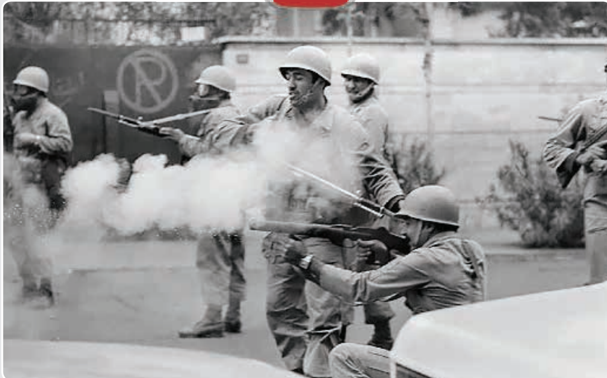
آتش گشودن گارد شاهنشاهی روی مردم در تظاهرات سال ۵۷