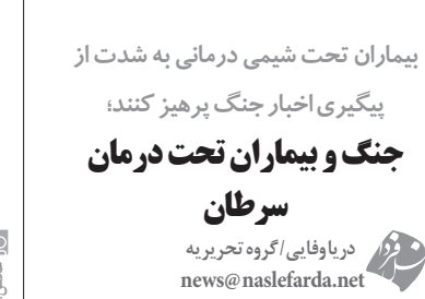
بیماران تحت شیمی درمانی به شدت از

در این تجمع، یک زن ۲۵ ساله از معترضان به تجاوز رژیم صهیونیستی به ایران، در گفت‌وگو با خبرگزاری فرانسه آنچه را که «قمار» بنیامین نتانیاھو نخست وزیر رژیم صهیونیستی خواند محکوم کرد. یکی دیگر از شرکت‌کنندگان در این تجمع ضدجنگ نیز اعلام کرد: «فقط به این دلیل که ما مخالف دولت ایران هستیم، به این معنی نیست که باید از حمله اسرائیل حمایت کنیم.»به گزارش ایرنا، بامسداد روز جمعه ۲۳ خردادماه، در پی حمله تروریستی رژیم صهیونی به تهران و تعدادی از شهرهای کشور، شماری از فرماندهان نظامی، دانشمندان و مردم غیر نظامی به شهادت رسیدند.