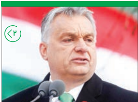
اوربان: هرگز مردم مجارستان را تهدید نکنید