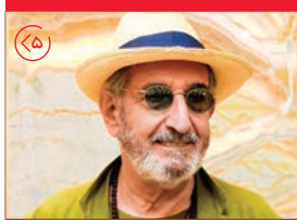
مراسم نکوداشت فرهاد آیش برگزار شد