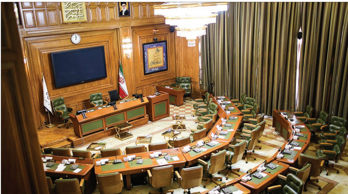
نزدیکان زاکانی دنبال تولید لیست و فهرست سازی برای انتخابات هستند

پرسش پایانی؛ آیا بشریت در قرن بیست و یکم شاهد بازگشت به بربریت است؟ پاسخ این سوال نه در غزه، که در واکنش ما به فریادهای کودکان گرسنه تعیین می‌شود.