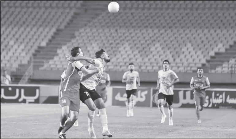
گلین وازیر به

پرسپولیس و سپاهان، دو تیم اول و دوم جدول رده‌بندی لیگ، باید در جام حذفی هم روبروی هم قرار بگیرند. مسابقه‌ای حساس و سرنوشت‌ساز، که می‌تواند پرورنده یکی از مدعیان اصلی این جام را ببیند. تقابل پرسپولیس و سپاهان علاوه بر لیگ بر تر، در جام حذفی هم پر حاشیه و پرتناق بوده است. از بین تقابل‌های قبلی آن‌ها، ۵ مسابقه بیشتر توانستند در ذهن طرقداران‌شان ماندگار شوند. شاید روز سوم اسفند، بازی آینده آن‌ها هم بتواند جایی در این لیست پیدا کند.