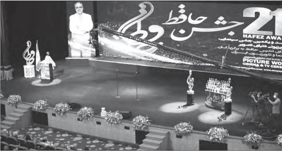
مراسم اهدای جوایز