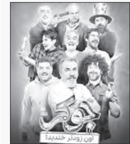
این روزگار خندیده

نمایش خانگی، به شهرام شاه‌حسینی برای سریال «می‌خواهم زنده‌بمانم» اهدا شد. تندیس بهترین بازیگر زن کمدی تلویزیونی و شبکه نمایش خانگی، به ژاله صامتی برای سریال «زیر خاکی» رسید. تندیس بهترین بازیگر زن درام تلویزیون و شبکه نمایش خانگی را، رعنا آزادی‌ور برای «زخم کاری» دریافت کرد. تندیس بهترین بازیگر مرد کمدی تلویزیونی و شبکه نمایش خانگی، به‌ش پژمان جمشیدی برای «زیر خاکی» اهدا شد. پژمان جمشیدی‌پس از دریافت تندیس خود، ابراز خرسندی کرد که اولین جایزه بازیگری‌اش را از جشن حافظ گرفته است. تندیس بهترین بازیگر مرد درام تلویزیونی و شبکه خانگی، به‌امیر آقایی برای بازی در «آقازاده» رسید. جایزه ویژه هیئت داوران در بخش بازیگری سینما و تلویزیون، به جواد عزتی برای «زخم کاری» و «شنای پروانه» اهدا شد و سرانجام، تندیس بهترین سریال تلویزیونی یا شبکه خانگی را، محمدرضا تخت‌کشیان، تهیه‌کننده سریال «زخم کاری» دریافت کرد.