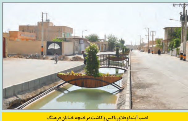
نصب آبنما و فلاورباکس و کاشت درختچه خیابان فرهنگ