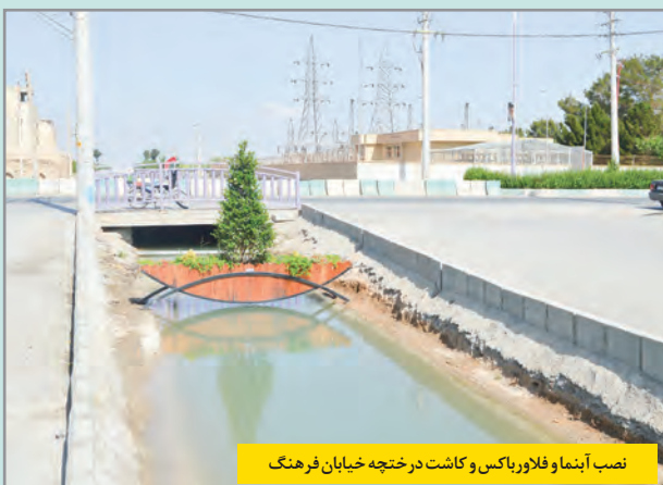
نصب آبنما و فلاورباکس و کاشت درختچه خیابان فرهنگ