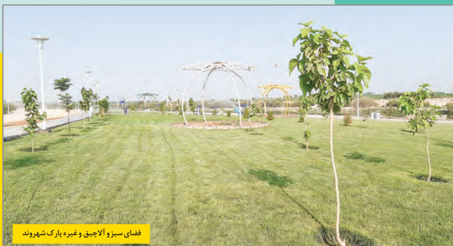
فضای سبز و آلاچیق و غیره پارک شهروند