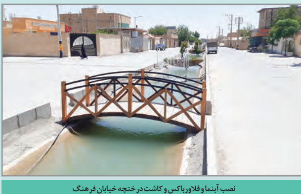
نصب آبنما و فلاورباکس و کاشت درختچه خیابان فرهنگ