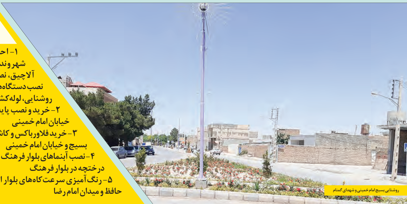
روشنایی بسیج امام خمینی و شهدای گمنام