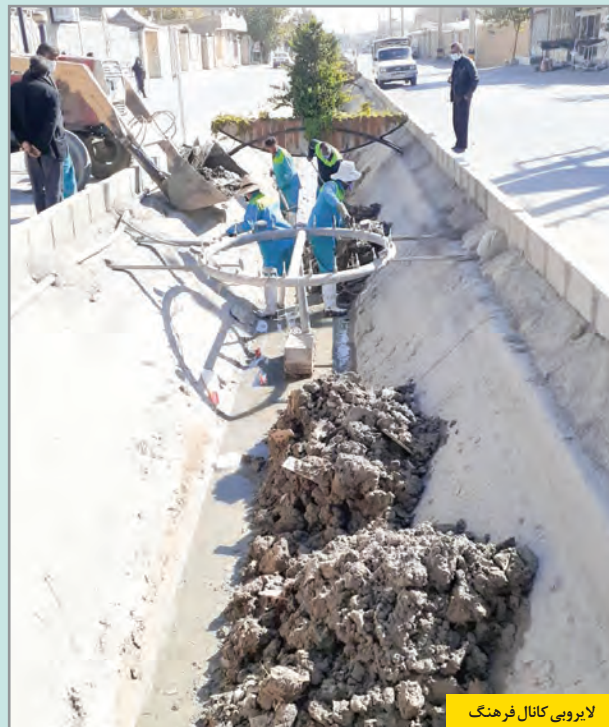
لایروبی کانال فرهنگ