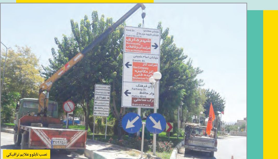
نصب تابلو و علائم ترافیکی