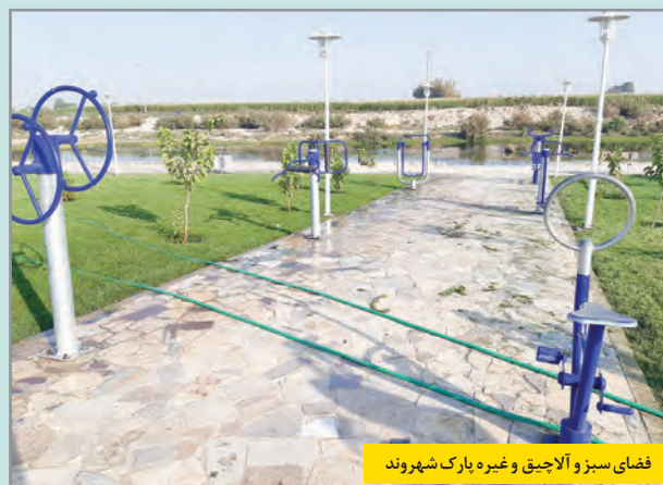
فضای سبز و آلاچیق و غیره پارک شهروند