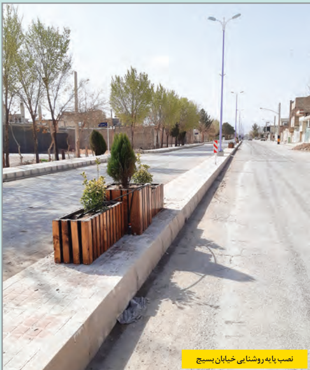
نصب پایه روشنایی خیابان بسیج