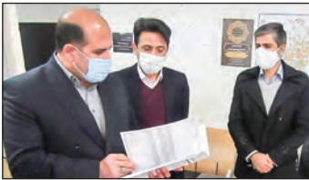
مازندران