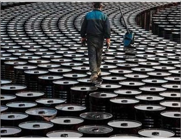
عسل ششای روسی

به میزان ۵۰۰ هزار بشکه در روز از ژانویه بازگرداند و تشدید کرد. ترامپ در آوریل میان اعضای اوپک پلاس میانجی‌گری کرد و آن‌ها را برای توافق در خصوص پیمان جدید کاهش تولید پای میز مذاکره برگرداند. انتخاب بایدن ممکن است باعث تغییر در روابط میان آمریکا و روسیه شود. وی روسیه را جدی‌ترین تهدید جهانی واشنگتن اعلام کرده است و در مبارزات انتخاباتی خود به ارزبایی مجدد روابط آمریکا با عربستان سعودی پرداخت. گروه اوپک پلاس در آخرین دیدار رسمی وزیرانش با افزایش تولید