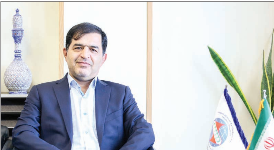
مدیرعامل شرکت نمایشگاه‌های بین‌المللی استان اصفهان

مدیرعامل شرکت نمایشگاه‌های بین‌المللی استان اصفهان: لازم‌ه رشد اقتصادی تقویت رویدادهای نمایشگاهی است