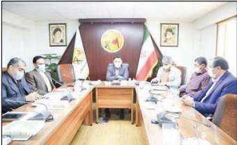
مازندران

مدیرعامل شرکت توزیع نیروی برق در نشستی که با حضور ایثارگران حوزه ستادی شرکت توزیع نیروی برق مازندران برگزار شد، با بیان اینکه استفاده از نظرات کارشناسانه و مشورتی این قشر از کارکنان در اولویت‌های برنامه‌ای شرکت قرار دارد، خواستار اهتمام خانواده‌های بزرگ ایثارگران شرکت توزیع نیروی برق مازندران در حل مسائل پیش رو در جهت پیشبرد اهداف توزیع برق مازندران شد.