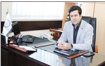
همدان / گروه استان ها news@naslefarda.net